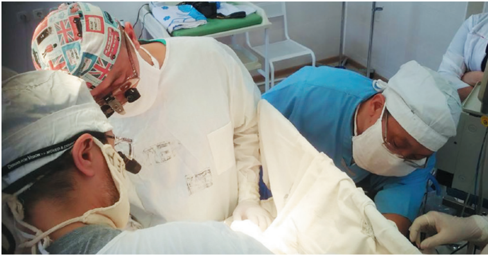
Во время операции

18 апреля специалисты Педиатрического университета провели в Карачаево-Черкесской Республике сложнейшую операцию новорожденному ребенку с атрезией пищевода с нижним трахеопищеводным свищем. Уникальность операции заключалась в том, что специалисты Педиатрического университета смогли провести ее всего в один этап.