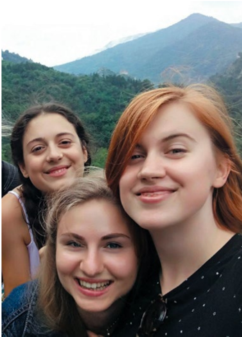
На практике в Болгарии