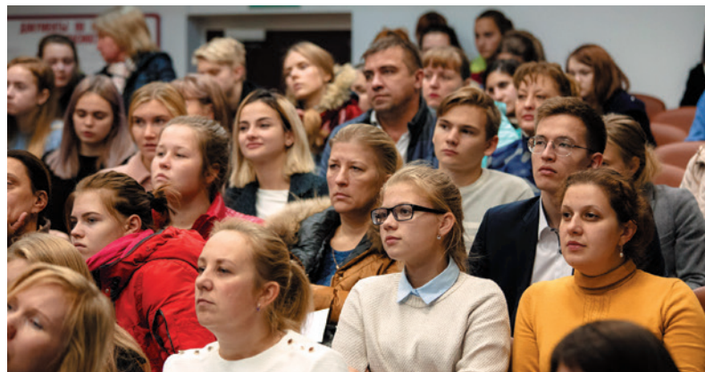
Гости дня открытых дверей

25 октября более 400 абитуриентов приняли участие в традиционном осеннем Дне открытых дверей.