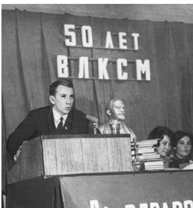
50 лет ВЛКСМ