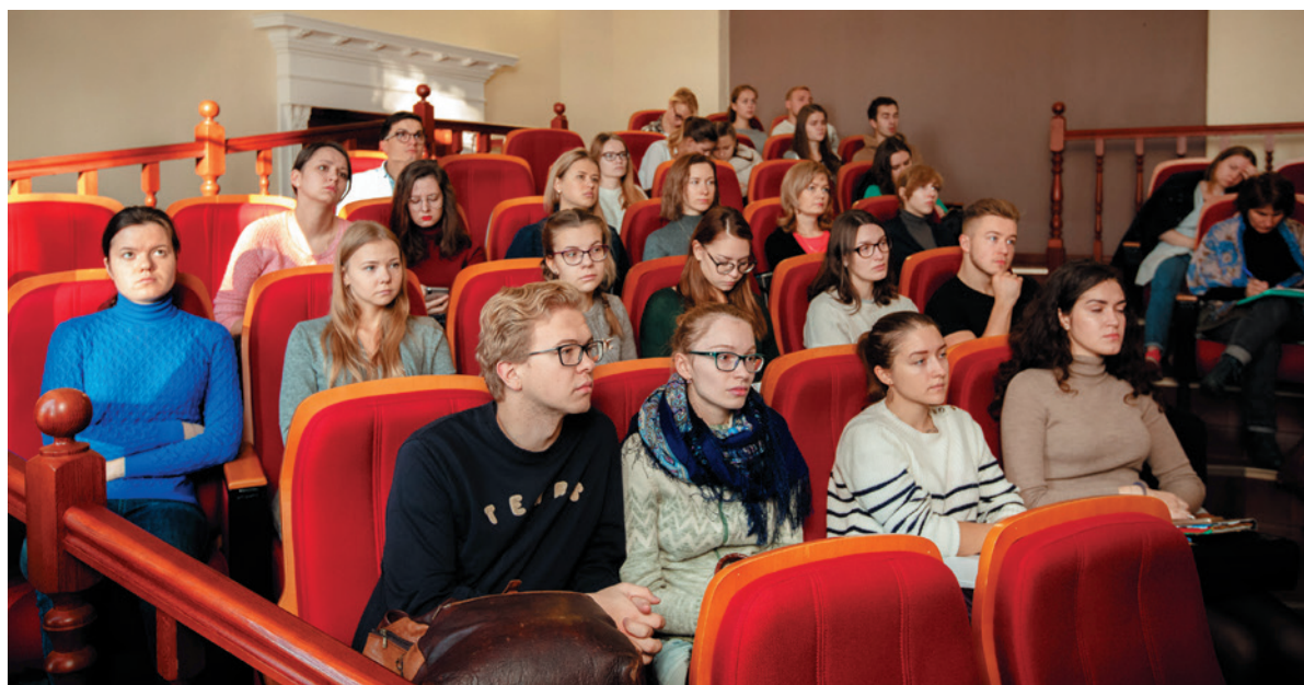
Слушатели в аудитории

циональных расстройств кишечника». Александр Свидзинский, одним из первых в мире выдвинувший теорию бактериальных биопленок в рецидивировании многих заболеваний человека, рассказал слушателям об исследованиях микробиом человека, роли микробиоты кишечника в этиологии заболеваний.