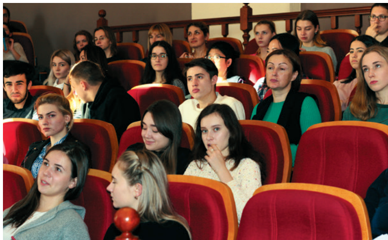
Слушатели в аудитории

Также в рамках конференции была проведена выставка постеров по теме «Солидарность и сотрудничество», подготовленных нашими студентами.