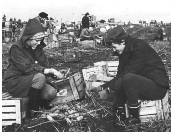
Выезд на сельхозработы