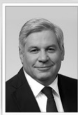
Раковщик Д.Г. (с 1989 по 1991 гг.)

Комсомольская организация ЛПМИ была создана в 1925 г.