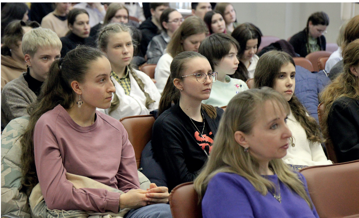
Зрители в зале