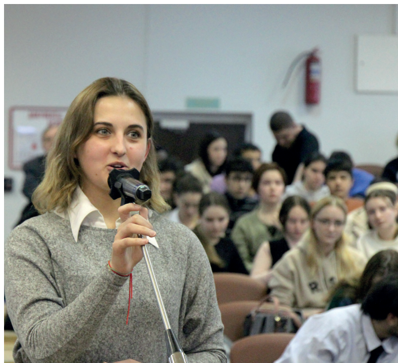
Вопросы о главном