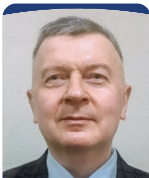
Успенский Юрий Павлович Главный внештатный специалист гастроэнтеролог Комитета по здравоохранению Правительства Санкт-Петербурга, д.м.н., профессор